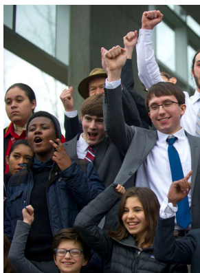
YOUTH v GOV

"Youth v Gov" es una nueva película que sigue la histórica demanda que 21 jóvenes han presentado contra el gobierno de Estados Unidos por su papel en la causa del cambio climático y por violar sus derechos a la vida, la libertad y la propiedad. (Subtitulada en español.)